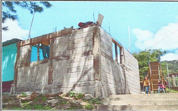
Foto 1: Area donde se esta realizando el mejoramiento de la estructura tipo portico para la cocina.