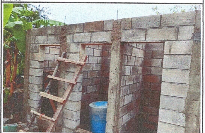
Foto 4: Area frontal, donde se esta realizando el mejoramiento de las paredes, piso y de sanitarios lavables.

Observación: Si es necesario se pueden agregar hojas adicionales y actualizar el número de hojas.