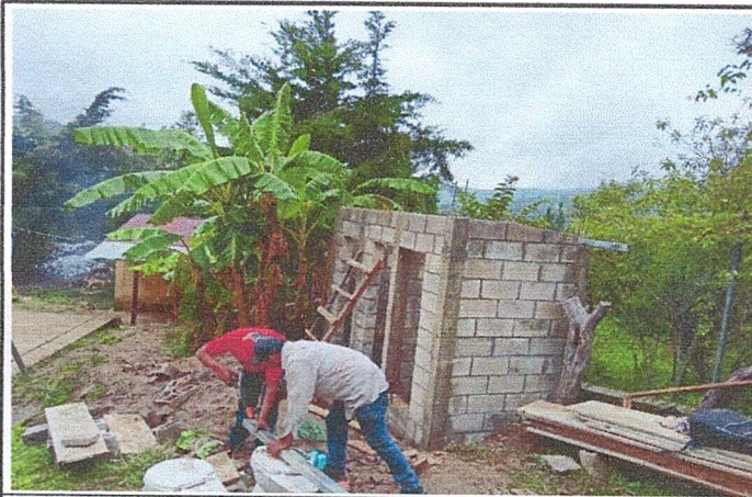
Foto 3: Area lateral, donde se esta realizando el mejoramiento de las paredes, piso y de sanitarios lavables.